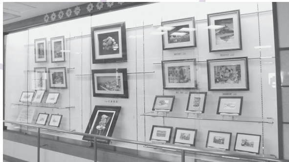
シャドウボックス&水彩ハガキ絵さんによる展示風景

ギャラリー ステップ ワンでは年間を通じて市民の皆さんの活動成果や作品などを展示しています。1月～3月の展示日程は右記のとおりです。お見逃しなく!