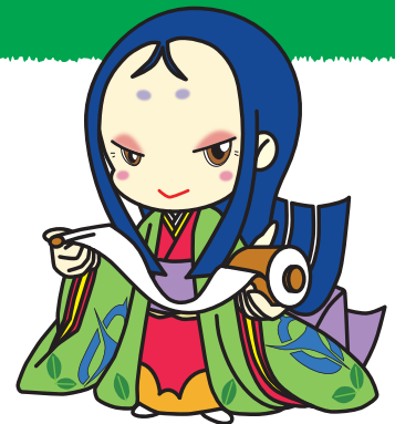
宇治市宣伝大使 ちはや姫

申請書の様式は市 HP ( https://www.city.uji.kyoto.jp/site/chihaya/6686.html ) からダウンロードできます。