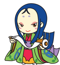
宇治市宣伝大使「ちはや姫」