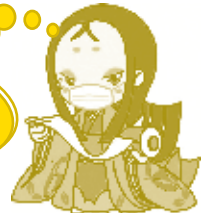
宇津町にんぎょ ちはや姫

女性を対象に「男女共同参画の視点からの防災」について学ぶセミナーを男女共同参画支援センターにて行います。