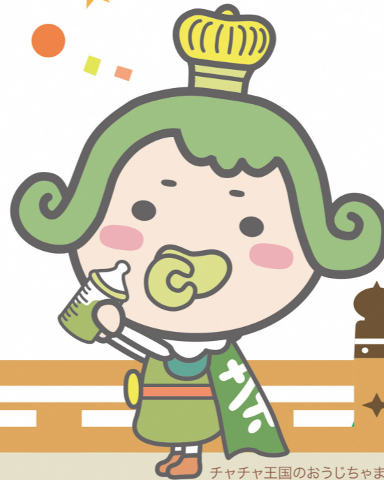
チャチャ王国のおうじちゃま

出生証明書(11)欄の体重及び身長は、立会者が医師又は助産師以外の者で、わからなければ書かなくてもかまいません。出生証明書(14)欄のこの母の出産した子の数は、当該母又は家人などから聞いて書いてください。この出生証明書の作成者の順序は、この出生の立会者が例えば医師・助産師ともに立ち会った場合には医師が書くように1、2、3の順序に従って書いてください。