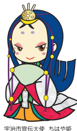
宇治市宣伝大使 ちはや姫

問 市民課 ☎20-8722 ✉ shiminka@city.uji.kyoto.jp