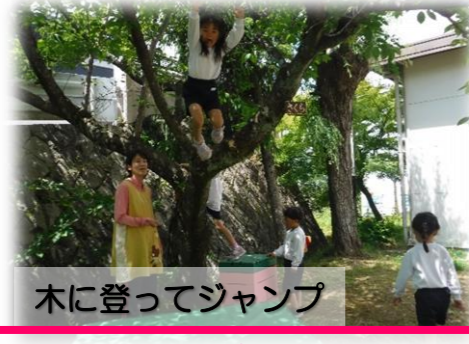
木に登ってジャンプ