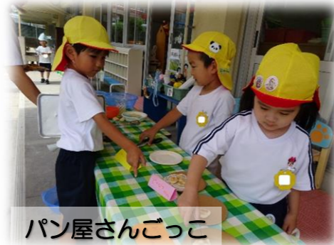
パン屋さんごっこ