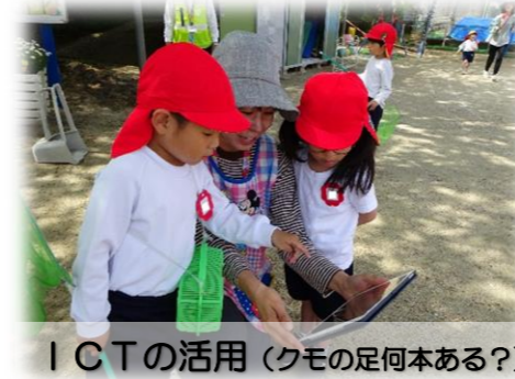
ICTの活用(クモの足何本ある?)