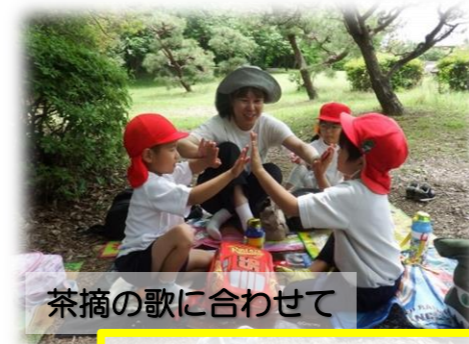
茶摘の歌に合わせて

8:45 登園 9:00 自ら選ぶ活動 片付け 学級全体の活動 担任とのひととき 11:45 降園