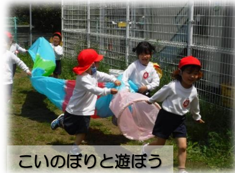
こいのぼりと遊ぼう