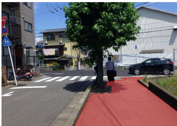
歩道カラー化(イメージ)