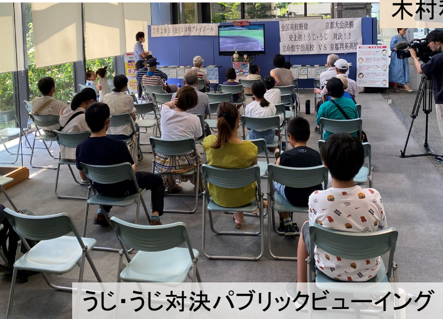
うじ・うじ対決パブリックビューイング