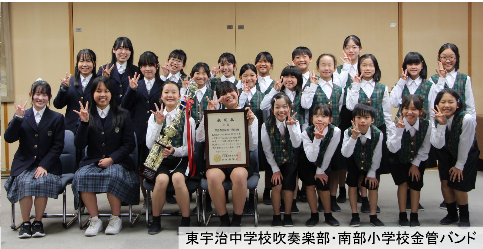
東宇治中学校吹奏楽部・南部小学校金管バンド