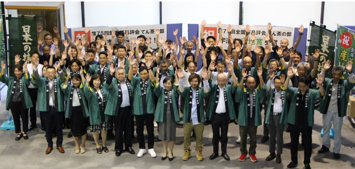
農林水産大臣賞・産地賞をW受賞