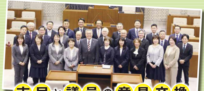
市民と議員の意見交換