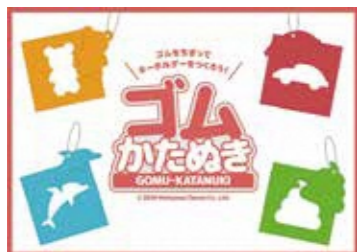
(株)西山ケミックス

いろいろなかたちのゴムを上手にちぎって、キーホルダーを作ろう! 定員：6人 対象年齢：制限なし