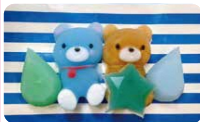
(株)ユー・エム・アイ

にぎって楽しいスウィーズを作りながら、ものづくりについて学べます。 定員：6人 対象年齢：制限なし