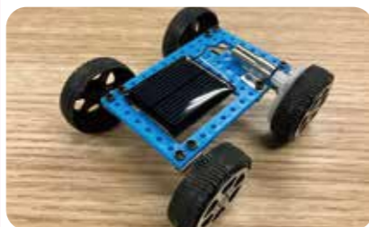
(株)エネコートテクノロジーズ

ミニカーにソーラーパネルを取り付けて、ソーラーカーを走らせてみよう! 定員：5人 対象年齢：制限なし