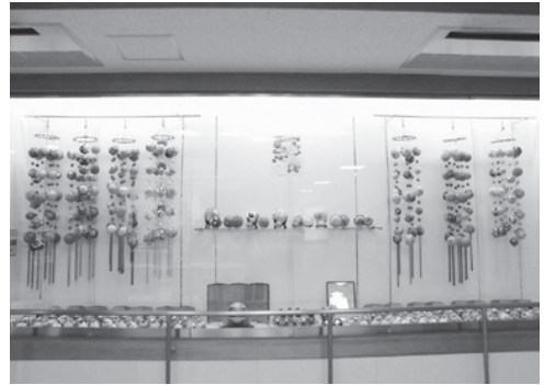
本年度第1回展示「宇治てまりの会」さん

性別や世代を超えたネットワークづくりを、 さらに一歩(ステップワン) 前進させる〈場〉に なってほしいという願いを込めています。