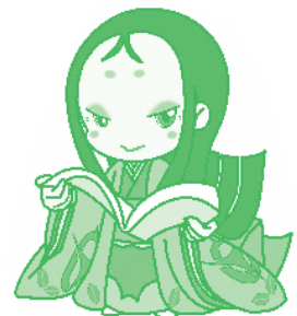
宇治市宣伝大使 ちはや姫

その取り組みの1つとして「男女共同参画週間キャッチフレーズ」を、毎年テーマを変え募集しています。平成30年度のテーマは「スポーツに関わるあらゆる分野での女性の参画を推進し、様々なスポーツに男性も女性も親しみ、チャレンジし、活躍できるようになるためのキャッチフレーズ」で、公募した結果、