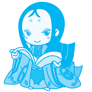
宇治市宣伝大使 ちはや姫

男女が、互いにその人権を尊重しつつ喜びも責任も分かち合い、性別にかかわらず、その個性と能力を十分に発揮することができる男女共同参画社会の形成に向け、「男女共同参画社会基本法」の目的及び基本理念に関する国民の理解を深めるため、国により「男女共同参画週間」が設けられました。期間は同法の公布・施行日(平成11年6月23日)を踏まえ、6月23日から29日までの1週間となっています。この週間において、地方公共団体、女性団体その他の関係団体の協力の下に、男女共同参画社会の形成の促進を図る各種行事等が全国的に実施されています。