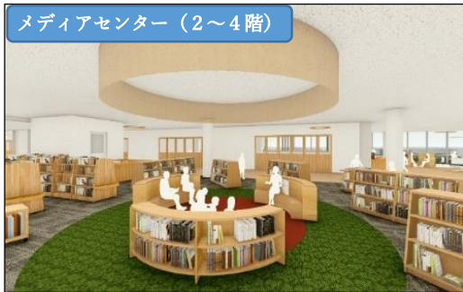
メディアセンター (2~4階)