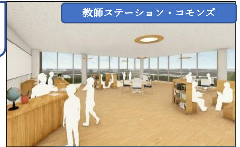
教師ステーション・コモンズ

校舎の中心にあって、できる限り廊下側の壁を減らすことで開放的な空間とし、子ども達が自然と本を手にとることができるメディアセンター(※1)